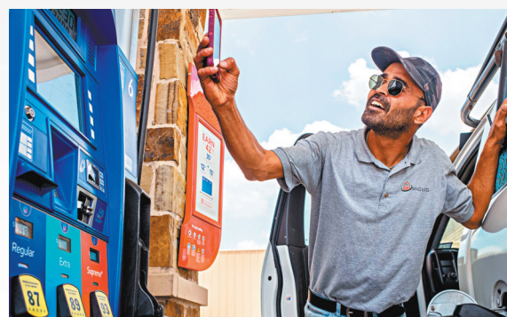
◆得州一名司機入油後用手機拍下油錶照片，打算傳給朋友。