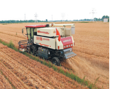
◆6月12日，山東濟南章丘區，位於黃河岸邊的金王村，麥田大面積豐收。

香港文匯報訊 據新華社報道，記者13日從中國國家糧食和物資儲備局獲悉，中國小麥產量持續提高，價格受國際市場影響較小。中國國家糧食信息中心首席分析師王曉輝表示，當前夏糧收割進度快，夏收期間晴好天氣為主，主