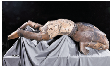
◆「仰臥俑」的姿態在兵馬俑中獨一無二。圖為「仰臥俑」側面姿態，左邊為其上半身。

團和細節，仍有待進一步深入研究。 [「28號俑」發掘出土時破損非常嚴重，由72塊殘片，12片殘渣組成，其頭部及雙手缺失。] 據秦始皇帝陵博物院相關人士介紹，「28號俑」的修復與展示極具挑戰性，由於該俑腹部和背部內壁的裂隙較大，為了保證陶俑修復及展示的安全性，修復人員在俑內壁用紗布加環氧樹脂膠粘劑進行加固處理。同時考慮到後期的可操作性和「28號俑」目前上半身與下半身暫未黏接。「28號俑」的保護修復共歷時九個多月時間，修復完成後俑身長154厘米，重101.4公斤。從一堆碎片殘渣逐個比對，再到逐步成型，直到再次顯露出兩千多年前的原貌，讓修復人員更為驚喜的是，有別於百戲俑坑中其他較為常見的站姿或坐姿的陶俑，「28號俑」呈現出仰臥的姿態，在目前已發現的兵馬俑中獨一無二，極其罕見。