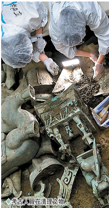
◆考古人員在清理文物。

除了肉眼可見的文物，考古學家們還通過現代科技手段，發現了絲綢、竹子、蘆葦、大豆，以及黃牛、野豬。在8個「祭祀坑」周邊，還發現灰溝、建築基礎以及小型祭祀坑，出土金器、有領銅璋、跪坐石虎、跪坐石人、綠松石和象牙等珍貴文物。出土文物的保護修復也在進行中，佔地面積66畝的三星堆博物館新館建設預計將於2023年完成，建成後公眾可以在博物館的「開放式」修復館裏與文物見面。