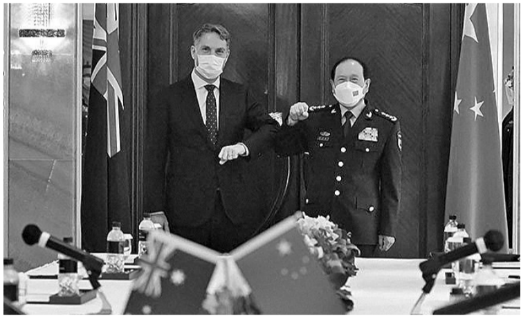
中国国务委员兼国防部长魏凤和与澳防长马勒斯12日在新加坡香格里拉对话上举行会谈。

【环球时报讯】中国与澳大利亚12日在新加坡第19届香格里拉对话(以下简称“香会”)期间举行了两国2020年1月以来的首次高级别官员会谈。澳大利亚广播公司(ABC)12日报道称，中国国务委员兼国防部长魏凤和与澳副总理兼国防部长马勒斯举行了面对面会谈，这标志着澳中外交关系解冻情况正式结束，也将被视为两国正出的积极一步，可能为双方更多高层会谈铺平道路。 ABC报道称，马勒斯将本次会谈描述为“坦承而全面的交流”，并强调这是“印太地区两个具有重要影响的国家间一次重要会议”，“是关键的第一步”。马勒斯坦承澳中关系“很复杂”，同时，“正是由于这种复杂性，对话非常重要”。在会谈中，马勒斯提出了澳大利亚关心的问题，包括中国最近在南海“拦截”一架澳大利亚皇家空军飞机的事件。他对中国在该地区的军事集结和迅速扩张表示“震惊”，宣称“需要从本质上理解中国对南海岛礁的军事化：即试图通过武力否认其邻