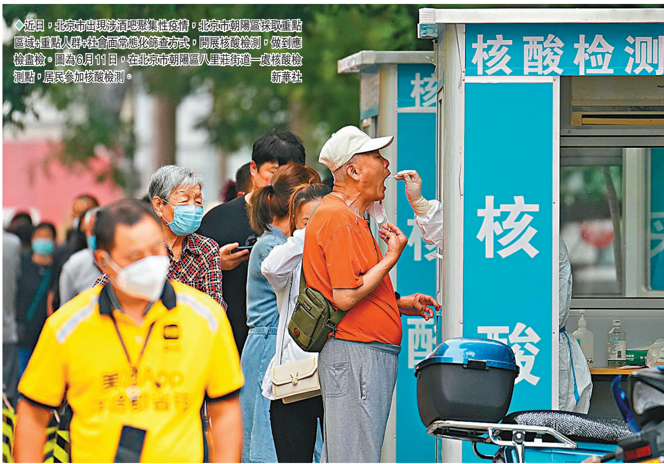
◀近日,北京市出現涉酒吧聚集性疫情,北京市朝陽區採取重點區域+重點人群+社會面常態化篩查方式,開展核酸檢測,做到應檢盡檢。圖為6月11日,在北京市朝陽區八里莊街道一處核酸檢測點,居民參加核酸檢測。

學生暫緩返校快遞不能入小區 因為該宗酒吧聚集性疫情,北京對原定的中小學、幼兒園返校時間作出調整,除非涉疫初三年級學生仍在6月13日返校外,中小學其他年級則繼續居家線上教學,並將根據疫情發展形勢,按照「分期分批、梯次返校」的原則進一步細化完善相關方案。 此外,北京在本地疫情的社會常態化防控方面,仍嚴格執行小區和公共場所掃碼查驗。目前北京各個社區、村都安排有24小時卡口值守,快遞人員仍不能「入區入樓」,民眾需要到小區門口的快遞櫃自取。進入各類公共場所、辦公樓宇,測溫掃碼、查驗72小時內核酸陰性證明成為常規舉措。乘客進入地鐵、公交時,地鐵全網和公交線路會啟動自動核驗乘客健康碼,「健康碼異常」的乘客將會被勸離。