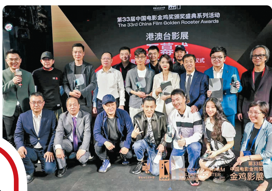
▲劉德華一直出錢出力支持電影圈的後起之秀。資料圖片

出名「快狠準」的著名音樂人舒文，蘇莊為《聲夢2》擔任評審，他在宣傳片段中笑言《聲夢2》最好睇的地方其實並非聽歌：「其實《聲夢》好睇嘅地方唔係嗰啲歌呀，佢更似一個真人騷，睇到佢地（參賽者）嗶嗶陣、會覺得點解佢地咁蠢，佢呢度又唱成點嘢，所以好睇在係對成件事投入。」