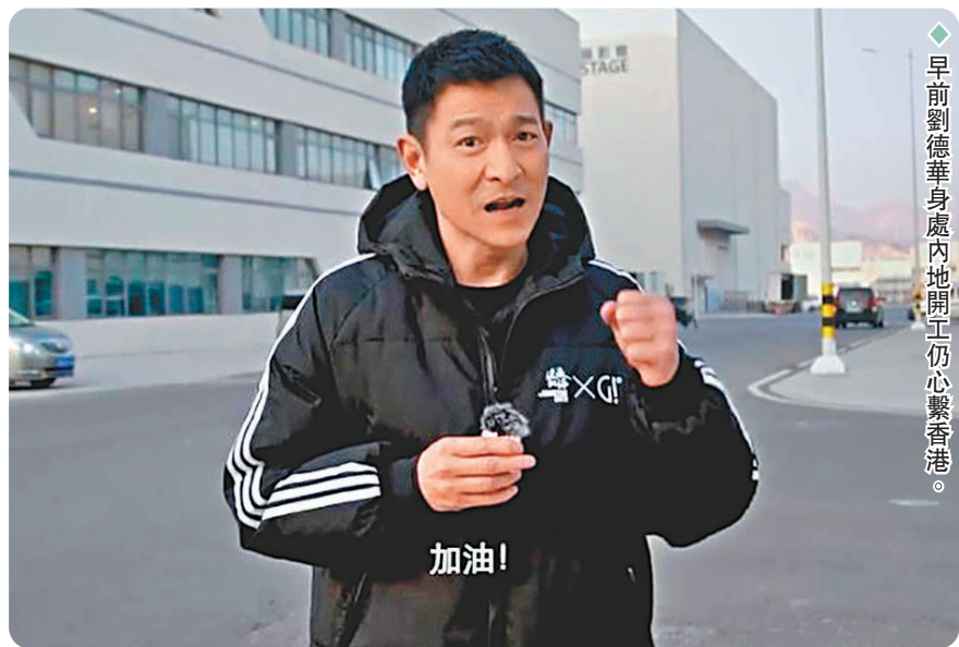
◆早前劉德華身處內地開工仍心繫香港。