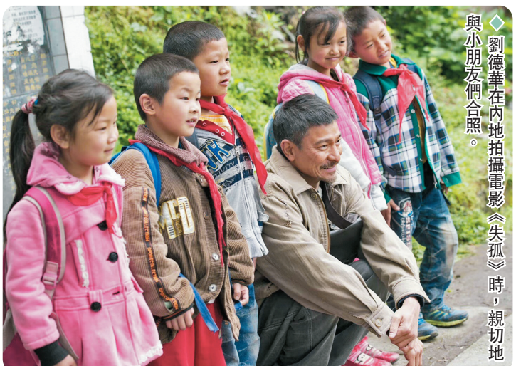
◆劉德華在內地拍攝電影《失孤》時，親切地與小朋友們合照。

香港特別行政區成立25周年主題曲《前》的MV中，劉德華唱道：「在這機遇面前，希望面前，好好地鍛煉。」他說，我們要把今天過好，把每一件事做好。這很重要。