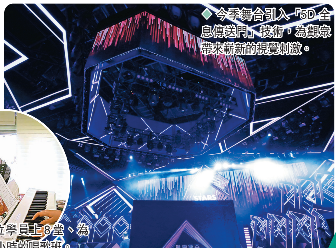
◆今季舞台引入「5D全息傳送門」技術，為觀眾帶來嶄新的視覺刺激。