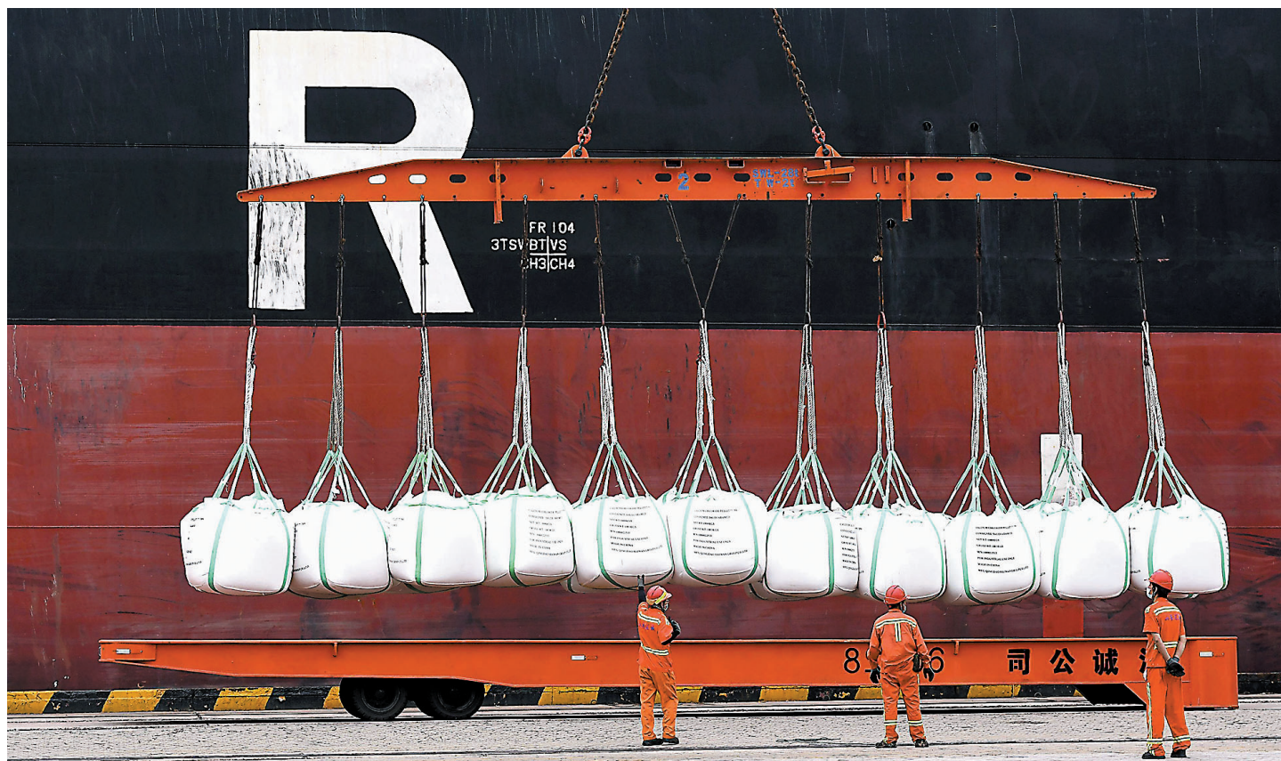
◆中國海關總署9日公布數據顯示,中國5月以人民幣計價出口同比增長15.3%,增速較4月大幅回升13.4個百分點;進口由4月的同比下降2%轉為增長2.8%。圖為6月9日,在山東港口青島港西聯碼頭,碼頭工人吊裝出口貨物。

趙萍認為,當前仍面臨國際經濟增長放緩和大宗商品價格、匯率波動等不確定因素影響,但中國外貿規模大、基礎好、韌性強,海運費用高、缺櫃、缺芯等不利因素正在逐步好轉,二季度外貿進出口將會持續向好。