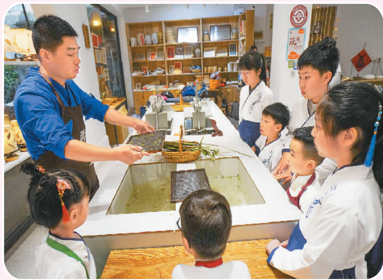
端午节期间，在浙江省温州市鹿城区甌说馆，非遗传承人向华裔青少年们讲述古法造纸术。