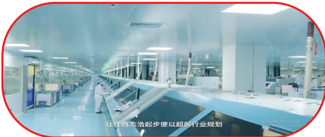
让江西志浩起步便以超前行业规划

江西志浩人将团结一心,依托“智慧工厂”管理体系,矢志不渝地做好产品品质、服务好每一个客户,用五到十年时间,全力以赴将龙南志浩科技打造成超百亿大型企业,为全国的电子信息产业和5G领域的发展做出自己的贡献。