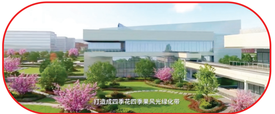
打造成四季花四季果风光绿化带