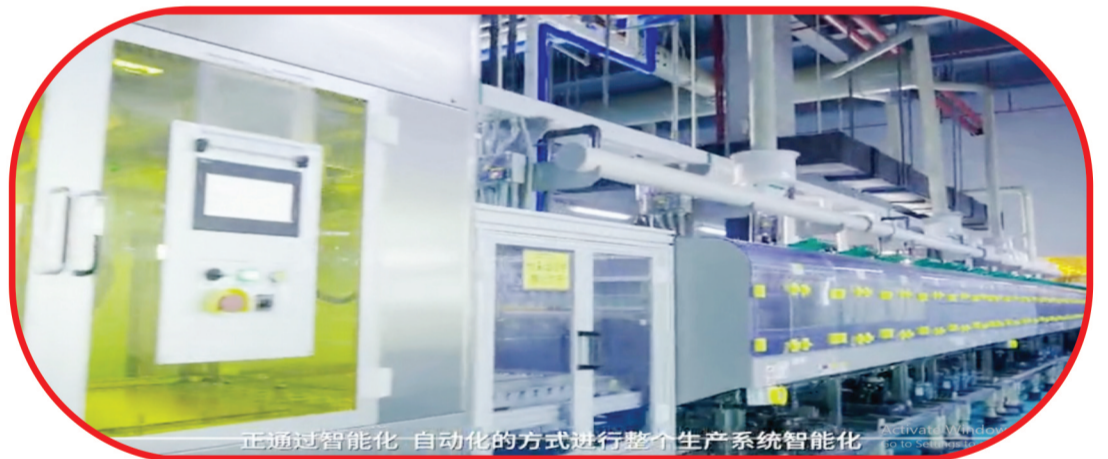
正通过智能化、自动化的方式进行整个生产系统智能化