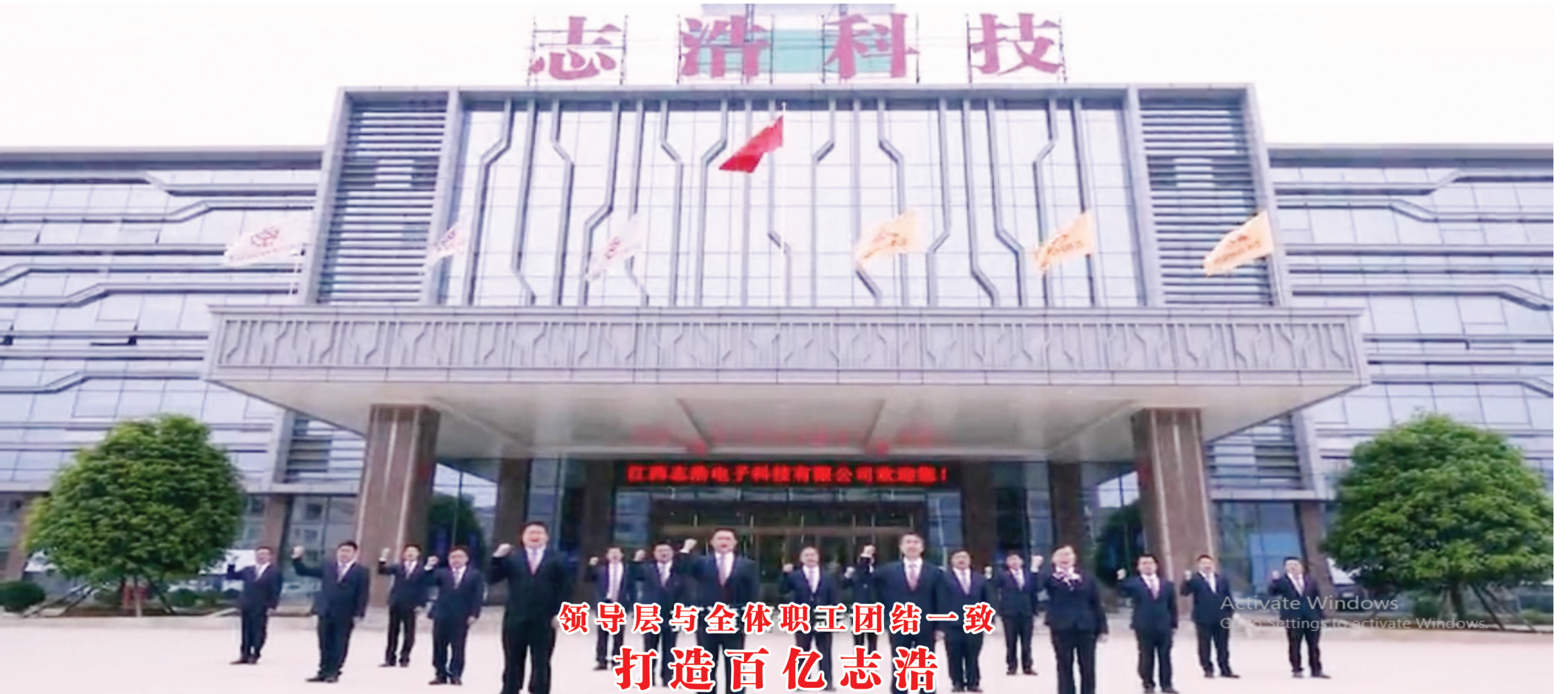
领导层与全体职工团结一致 打造百亿志浩