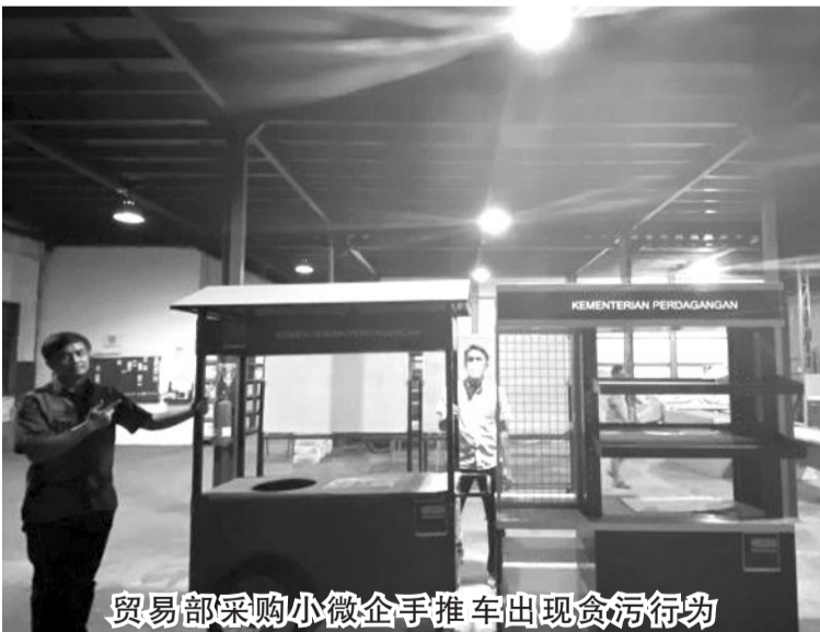
贸易部采购小微企业手推车出现贪污行为

【本报讯】国家警察刑事调查局的腐败犯罪部揭露了贸易部2018和2019财政年度，为采购小微企业的手推车涉嫌腐败案件的作案手法。 调查阶段于2022年5月16日开始，警方怀疑存在加价或夸大行为，以及采购了虚构的推车。 周三(8/6)，国警刑公关局新闻处主任艾哈迈德·拉马丹准将(Ahmad Ramadhan)指出，在实践中，采购手推车存在虚构现象，并提高了手推车的价格，导致国家遭到损失。此外，贸易部购买的手推车质量低劣，因此，民众拒绝接受这些不按规格的手推车。在这种情况下，怀疑国家遭到损失。然而，国家警察仍在进行调查，并与国家财政局合作，以探讨所造成损失的价值。 在2018预算年度，政府通过贸易部准备了一个价值490亿盾的项目，以采购7,200辆手推车。然后，在2019年，政府还制定了一个价值260亿盾的项目，采购3,570辆手推车。2018-2019年采购贸易车的预算合同总价值为763亿7272万5000盾。 为小微企业采购手推车应该旨在帮助民众和发展经济。这个案子发现的原因是。有一些民众本应该得到手推车的