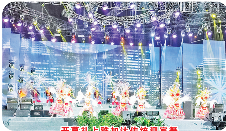
开幕礼上雅加达传统迎宾舞

Covid19 疫情大流行影响，而推迟了两年后，该活动可以再次被商业参与者用来参与为国民经济的崛起创造动力。疫情大流行之后，雅加达博览会的国内和世界市场重新崛起，以“前进，印度尼西亚产品”为主题。有 2500 家企业参展，并有 1500 各摊位参与。