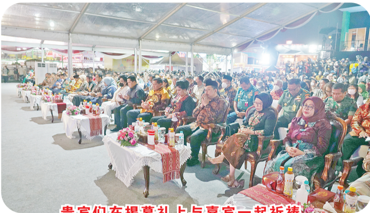
贵宾们在揭幕礼上与嘉宾一起祈祷