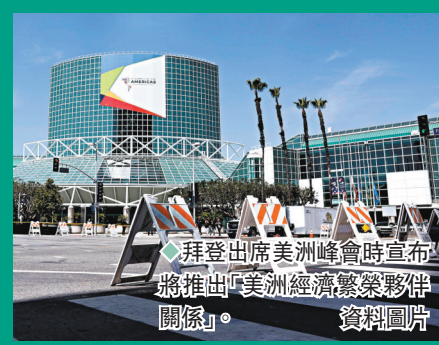
◆拜登出席美洲峰會時宣布將推出「美洲經濟繁榮夥伴關係」。資料圖片