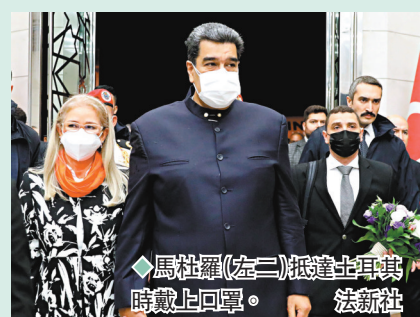
◆馬杜羅(左二)抵達土耳其時戴上口罩。

美國未有邀請委內瑞拉總統馬杜羅出席今屆美洲峰會，馬杜羅7日抵達土耳其進行正式訪問，抵埗時獲土耳其高級官員熱烈歡迎。