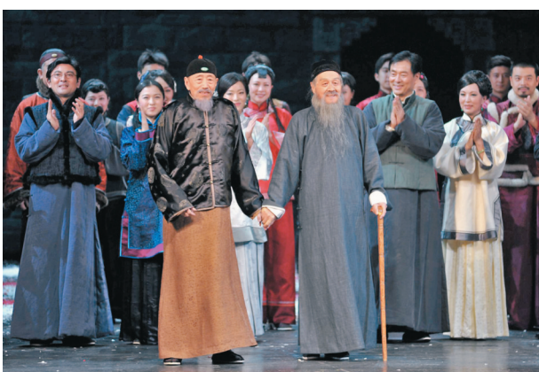
◆2011年6月23日北京人藝年度大戲《家》上演。演出結束後，年過八旬的老藝術家藍天野（前右）、朱旭（前左）和演員們一起謝幕。