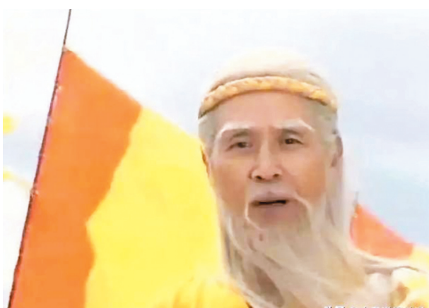
◆藍天野在電視劇《封神榜》中飾演姜子牙，慈眉善目、仙風道骨，形象令幾代觀眾難忘。