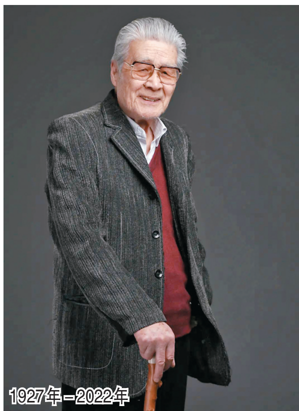
◆北京人民藝術劇院表演、導演藝術家藍天野於8日在北京家中逝世，享年95歲。

藍天野演電視劇的遊刃有餘，源自他深厚的話劇舞台積累，有媒體報道，姜子牙與王子濤，前者不是他很想演的角色，後者則是本色演出，但就呈現出來的演出效果看，各有各的精彩。