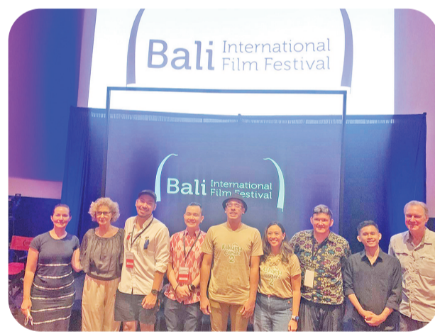
各导演和演员们合影