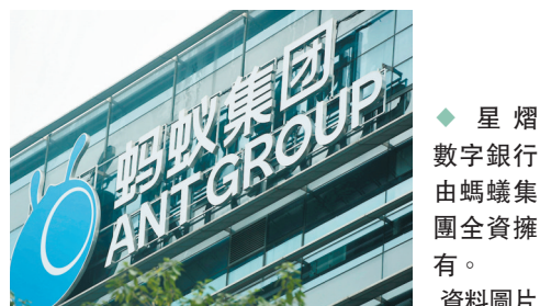
◆星熠數字銀行由螞蟻集團全資擁有。 資料圖片

星熠數字銀行與新加坡中小企業服務機構Proxtera簽署為期兩年的諒解備忘錄。Proxtera由新加坡金管局、資訊通訊媒體發展局（IMDA）和私營部門實體支持的企業，旨在通過建立市場平台，改變和實現中小企業和企業之間的跨境貿易。目前使用Proxtera網絡服務的亞洲和非洲的中小企業有40萬家，未來星熠銀行將率先為Proxtera網絡平台上的買家和賣家提供金融服務。另外，作為一家數字批發銀行，星熠銀行將成為Alipay+和螞蟻旗下跨境支付公司「萬里匯」兩大業務的關鍵組成部分，為東南亞的小微商家以及中國內地出海企業，提供更多元的全球數碼金融服務新商機。