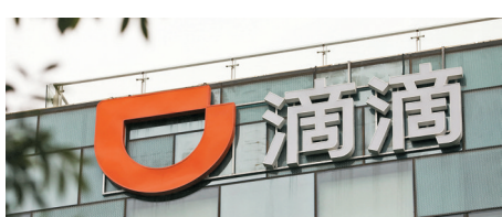
◆據外電報道，中國準備最早於本週容許滴滴的App重新上架，恢復新用戶註冊。 資料圖片

摩根士丹利研究報告指出，隨着內地股市質量回升，相信A股投資情緒已從年內的低位修復，後市需關注內地供應和生產的實際恢復速度，以及其他寬鬆措施的實施。高盛亦稱，內地公司的盈利料在第三季觸底，故相信MSCI中國指數在未來12個月有20%的上漲空間，而政策支持的股票可看高一線，高盛建議買入國策受惠股，但地緣政局和疫情等風險仍會影響中資股表現。