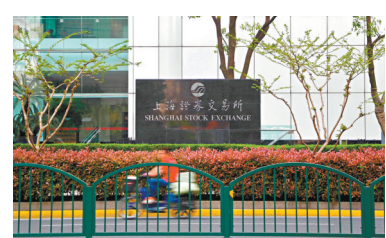
◆滬指6日收報3,236點，漲40點。

興業證券分析，4月底以來，隨着內地疫情逐步改善，疊加美債利率顯著回落、來自海外的擾動緩和，科創板率先突圍、領跑市場。中期來看，2022年科創板或類似2012年的創業板，成為引領新一輪上行的主線方