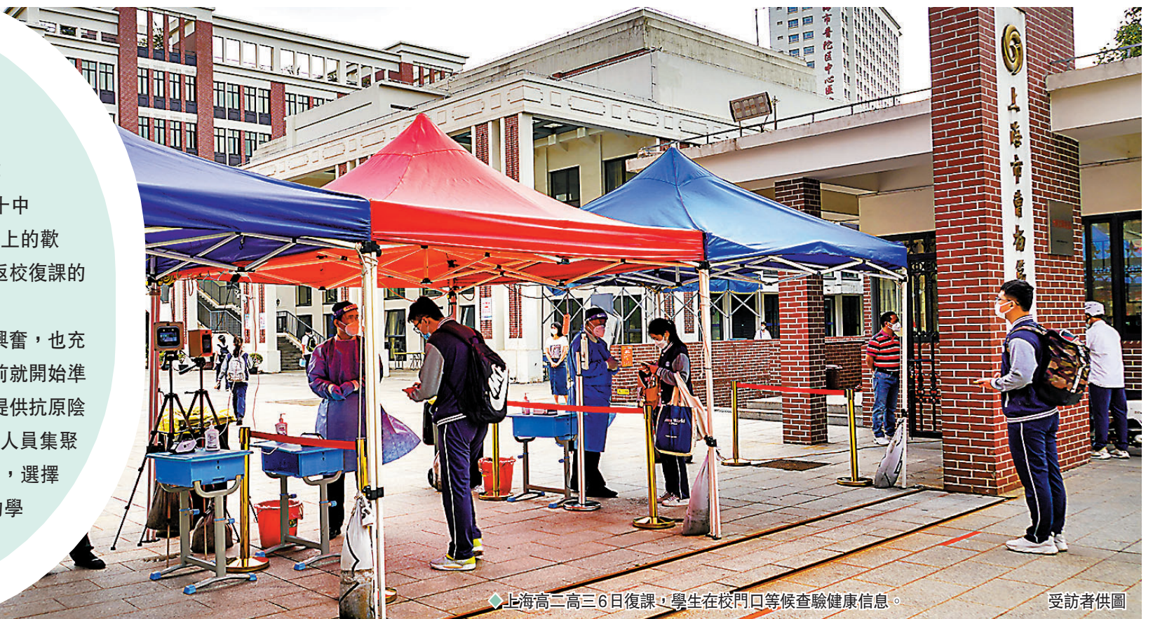
◆上海高三高二6日復課,學生在校門口等候檢驗健康信息。

回到闊別近三個月的校園,很多同學都非常興奮,也充滿期待。為了迎接他們歸來,各校從至少一周前就開始準備。自即日起,每位回校上課的學生,都必須提供抗原陰性證明,經過掃碼、測溫方可入校。為了減少人員聚集的風險,大多數學生和家長都捨棄了公共交通,選擇步行、單車或私家車出行。還有一些有條件的學校,則安排了通勤大巴送學生往返。