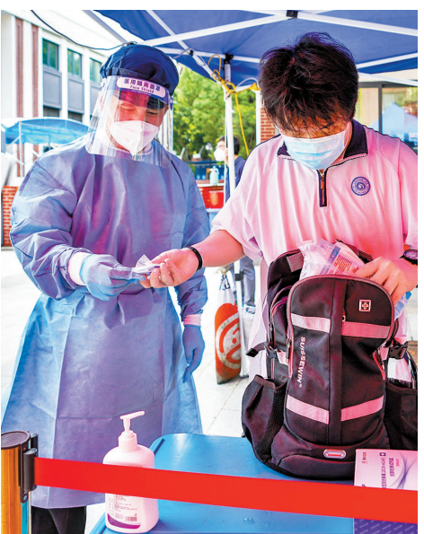
◆學生入校前將抗原試劑盒交給學校工作人員。