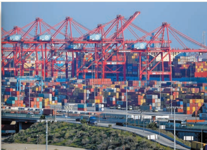
位於加州長灘的貨櫃港，是美國西岸處理來自亞洲貨物的主要港口。