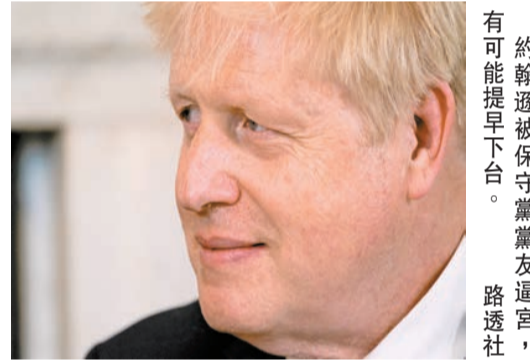
約翰遜被保守黨黨友逼宮，有可能提早下台。

支持者認為，約翰遜可望獲得過半的180名議員支持，繼續執政，但分析認為，即使出現這樣情況，但亦會削弱約翰遜的權威。前首相文翠珊在2018年8月避過不信任動議，但自此之後處於弱勢，最終在數月後被迫自行辭職，繼而引發黨內權力鬥爭，最終由約翰遜脫穎而出。 即將年屆57歲的約翰遜，在2019年7月接替文翠珊，出任首相，帶領英國成功脫離歐盟，及協助保守黨在2019年底大選中贏得過半議席，繼續執政，但其後被揭發在2020年起當局實施防疫封鎖措施期間，多度違規在唐寧街首相府舉行派對，導致非法聚會盛行。約翰遜數次就違規行為道歉，但堅拒辭職，引起朝野不滿，保守黨上月在地方選舉失去近500席及11個議會控制權，目前支持率落後工黨20個百分點。近期英國通脹升至9%的40年新高，約翰遜民望插水，他前日出席英女王登基70周年慶典時，遭民眾喝倒彩及嘲笑。