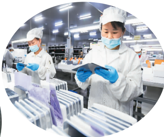
▲江西省宜春市加大对外贸企业的支持力度，帮助外贸企业应对疫情、抢抓市场机遇，开足马力满足国内外市场需求。图为宜春市宇泽（江西）半导体有限公司的员工在赶制出口新加坡等国的太阳能硅片。