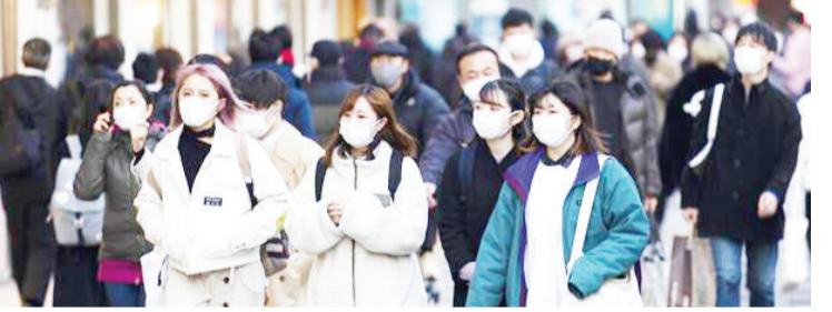
资料图:日本东京街头戴着口罩的人们。

中新网6月7日电 据日本共同社报道,日本国土交通省7日发布了面向恢复接待访日游客的新冠防疫对策指针。