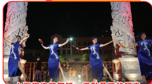
上海旗袍裝舞蹈，扭動柔活的腰身