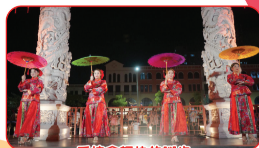
手持傘輕快的腳步

户，老上海广场管理层也要测量体温，在房间内使用口罩，并保持社交距离。同样管理层也将访客在进入老上海地区的各个入口进行 Pedulilindungi 扫描的义务。为鼓励访客始终保持清洁，老上海管理层还在整个老上海地区提供洗手液。每日开放从周一至周五上午10点至晚上10点，周六至周日和国定假日从上午07点至晚上11点。周六、周日，还有精彩的舞蹈演出。老上海有三个特色入口处，即帝都、凤凰门和虎门。