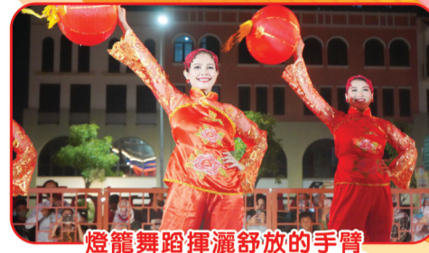
燈籠舞蹈揮灑舒放的手臂