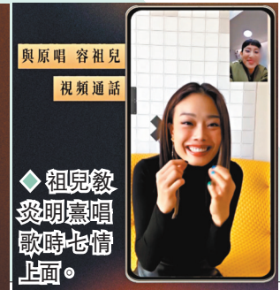
與原唱容祖兒視頻通話。