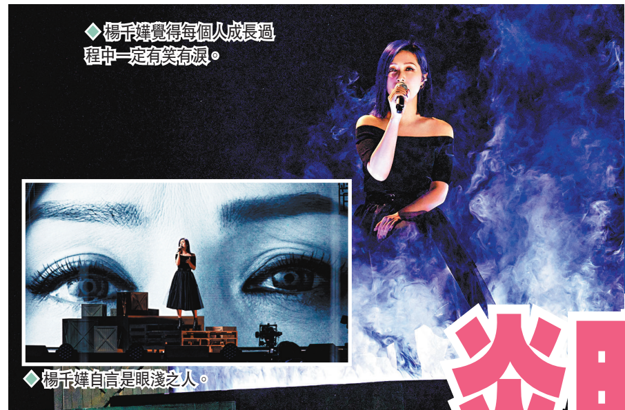
楊千嬅覺得每個人成長過程中一定都有笑有淚。