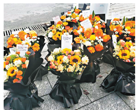
◆ 榕江站廣場前的鮮花。

機楊勇君。我們常年在外跑的人，全靠這些英雄的司機保護我們，他們就是我們的保護神、護身符。他也是別人的兒子，別人的丈夫，別人的父親，為保護我們犧牲了。向英雄致敬，希望天堂沒有意外。——一個普通人的致敬」「平地驚雷，聞英雄噩耗；小子不才，願同志千古。——南京金童送上」