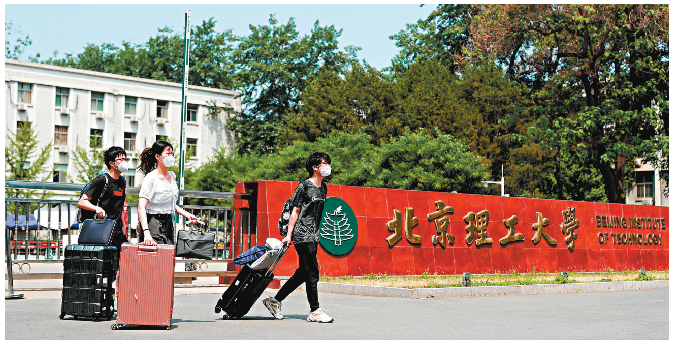
◆ 滿足相應防疫條件的學生，返鄉後不再進行集中隔離。確需進行隔離的學生，將免除集中隔離費用。圖為6月3日，北京理工大學的學生離開該校中關村校區。

據悉，目前已有多個城市出台了針對高校學生的返鄉免費隔離政策。其中，河南鄭州5月23日就發布消息稱，來自上海等發生本