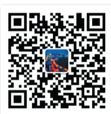
青島發佈官方微信二維碼

海風·浮山灣之夜”大型文旅體展演秀是青島面向全球的一次城市旅游新型推介活動，緊緊把握住了全民微旅游、城市雲端游、市民深度游發展的新脈搏，既是青島依托海洋資源和奧運人文景觀，打造時尚體育旅游品牌的一次成果展示，也是體育與文化、旅游等多元業態跨界融合，激發行業聯動與品牌增值，為構建全產業鏈注入新動能、新活力的一次重要探索。（宋新華）