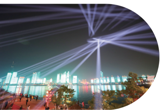
【“五月的海風·浮山灣之夜”為觀眾帶來一場光影融合的視覺盛宴。】

5月14日晚，一場名為“五月的海風·浮山灣之夜”的大型文旅體展演秀活動，讓青島再次“出圈”，在網絡上掀起了一場“雲端旅游”高峰。僅青島主流新媒體觀海新聞直播間就有128萬多位網友參與。