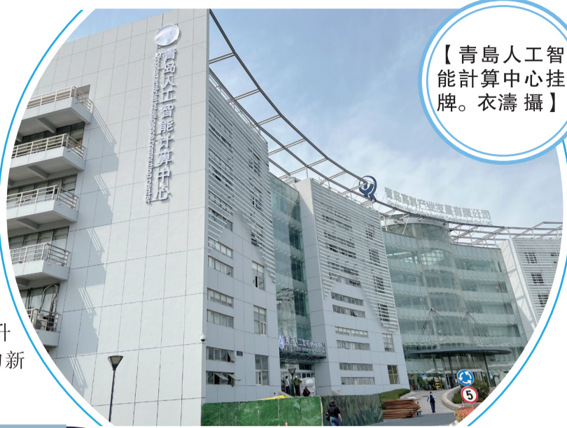
【青島人工智能計算中心掛牌。】

惠算力底座，打造立足於青島的公共算力服務平台、應用創新孵化平台、產業聚合發展平台、科研創新與人才培養平台，推動青島人工智能成為產業智能化升級、人才引育留用的新引擎。（蘭君妍）