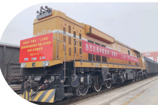
【上合示範區首班大豆回程專列抵達。】

5月13日上午，隨著搭載62節40英尺集裝箱、1600多噸大豆的列車緩緩駛入青島多式聯運中心，上合示範區迎來了中歐班列（齊魯號）“上合快線”首班大豆回程專列，這也標志著上合示範區在貫通東西多式聯運物流運輸大通道的基礎上，進一步拓展了國際貨運班列糧食進口渠道。