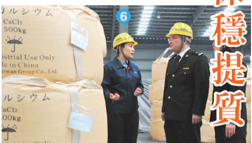
【海關工作人員深入青島化工產品出口企業調研。】