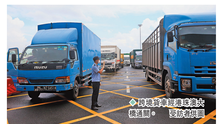
◆ 跨境貨車經港珠澳大橋通關。

作為珠港澳大橋西延線的重要組成部分，跨越珠海與江門兩市的黃茅海跨海通道總投資超138億元。施工方中鐵十一局透露，目前兩座主橋的5座主塔已完成建設總量的25%以上，全線3,000多根樁基已完成80%，預計2024年全線建成通車。屆時，將打通港澳通往粵西地區的大動脈，進一步拓展港澳地區的發展腹地。而該項目還將與珠港澳大橋、深中通道、南沙大橋、虎門大橋共同組成粵港澳大灣區跨海跨江通道群，加快大灣區形成世界級交通樞紐。