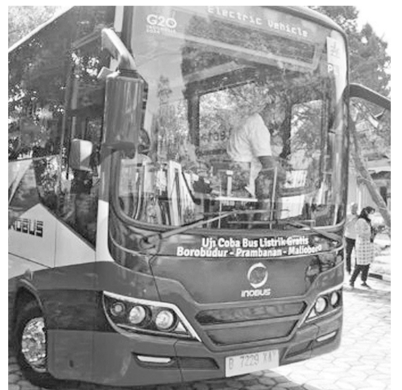
电动巴士亮相 6月4日,海事与投资统筹部长卢虎(Luhut Binsar Panjaitan)在吉冷为公共充电站主持开幕仪式。图为由印尼火车公司(INKA)制造的电动巴士在婆罗浮屠佛塔旅游区亮相。