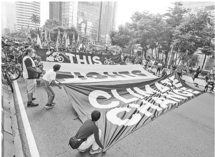
世界环保纪念日 绿色和平组织和Bike 2 Work数位活动家在雅加达举行世界环保纪念日活动。

国电公司则因为承担不调升客户电费,直至今年年底将造成大约71.1万亿盾价值的亏损。(hhsh)