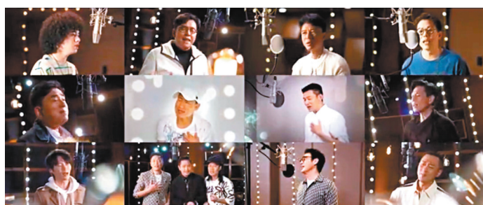
◆張學友、劉德華、譚詠麟、鍾鎮濤、李克勤等率領一眾男歌手合唱。

林曉峰也希望大家能一起來感受時代港星大合唱的氛圍感,一起來慶祝香港回歸祖國25周年!