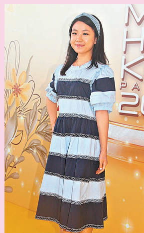
◆這位面試者年紀最小,只有17歲半。