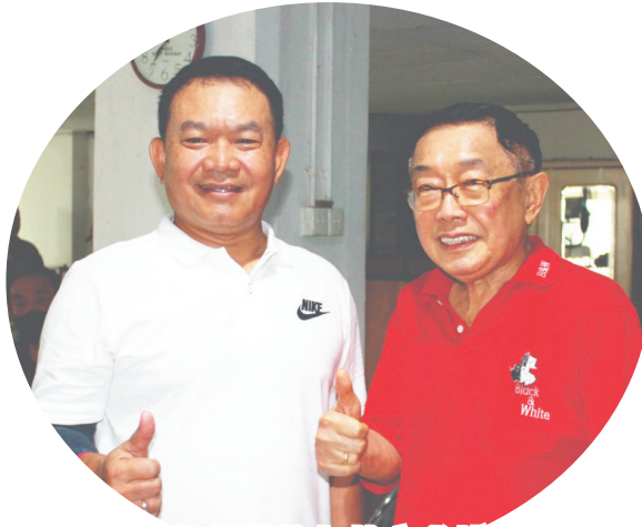
杜东参谋长与林文光博士

【本报泗水讯】为了加强团结和保持身体免疫力,金锋集团(Maspion)集团总裁林文光博士和陆军参谋长杜东(Dudung Abdurachman、dengkul)俱乐部基金会,于5月21日在泗水Delta Plaza店屋进行乒乓球比赛。