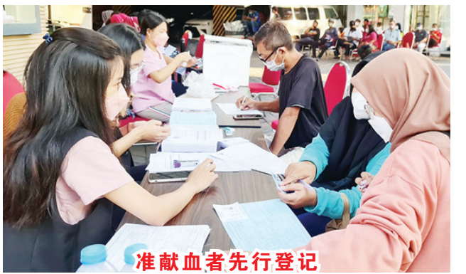
准献血者先行登记