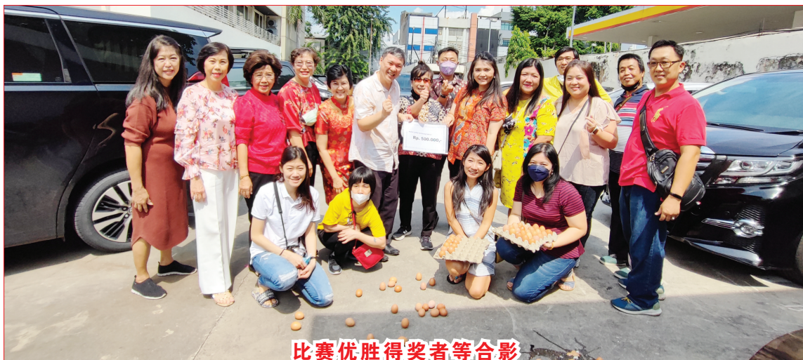
比赛优胜得奖者等合影