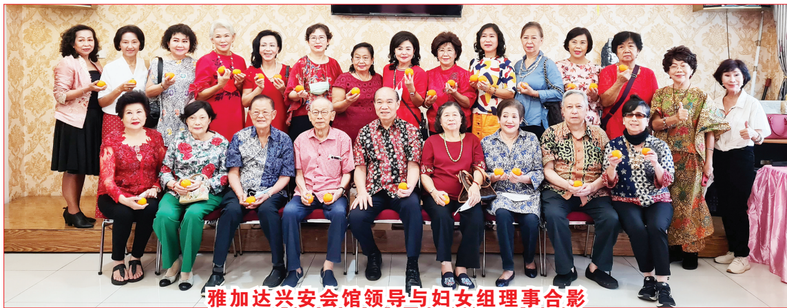
雅加达兴安会馆领导与妇女组理事合影