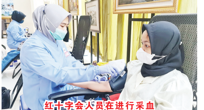
红十字会员在进行采血