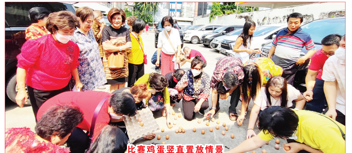
比赛鸡蛋竖直置放情景