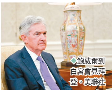
鮑威爾到白宮會見拜登。