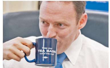
◆墨菲斥白宮沒有「理智的計劃」來遏制通脹。

示，從民調結果來看，通脹是當前美國民眾最關心的經濟問題，但白宮卻沒有提出所謂「理智的計劃」來遏制通脹增長，反而忙於與政治對手相互指責。