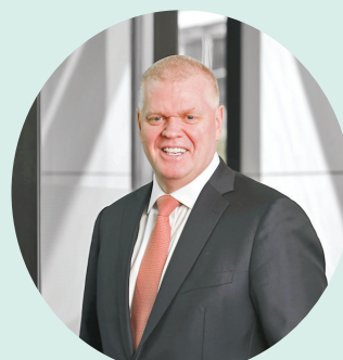
◆祈耀年稱，中國仍具備充裕的政策刺激空間，預期經濟可實現強勁復甦。

香港文匯報訊 滙豐控股行政總裁祈耀年(Noel Quinn)日前接受新華社記者書面專訪時表示，儘管短期內市場可能仍將出現一些波動，但滙豐依然看到中國經濟展現出的韌性和蘊含的長期增長潛力、發展機遇以及對海外企業和投資者的吸引力。