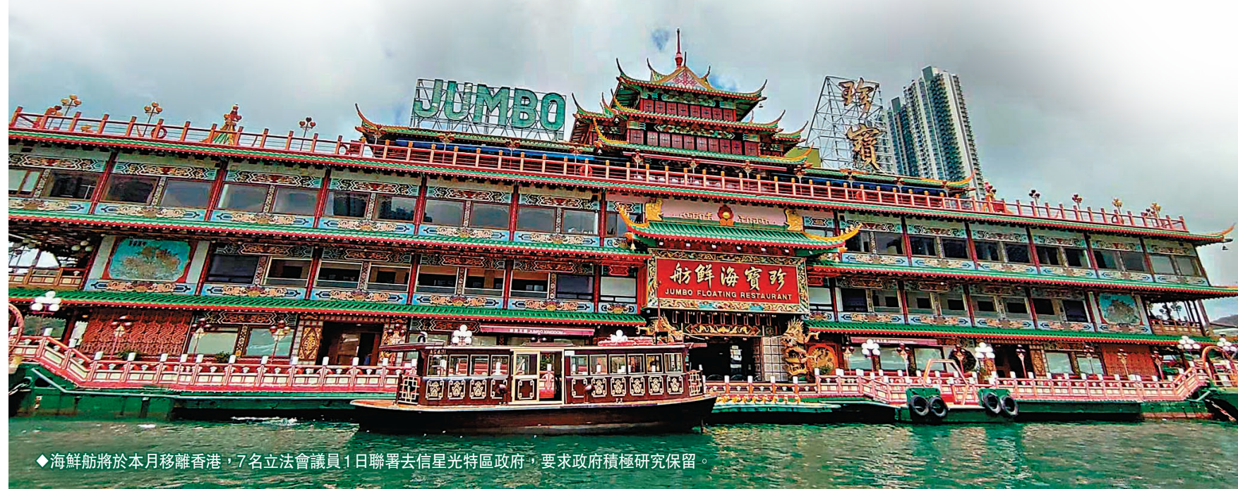
◆海鮮舫將於本月移離香港，7名立法會議員1日聯署去信星光特區政府，要求政府積極研究保留。