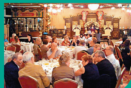
◆昔日的珍寶海鮮舫門庭若市，為訪港旅客熱門景點。