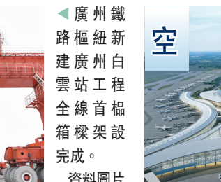
廣州白雲國際機場T3航站樓工程效果圖。

香港文匯報訊 廣東新鮮出爐《廣東省貫徹落實國務院〈扎實穩住經濟的一攬子政策舉措〉實施方案》(下稱《實施方案》)，從6個方面形成131項實招，推動國務院《扎實穩住經濟的一攬子政策舉措》落地。 其中，成立「省重大項目並聯審批工作專班」，支持銀行機構精準對接廣東省1,570個重點項目和103個關鍵項目以及珠三角產業梯度轉移項目，並加快打造「軌道上的大灣區」。 廣東省發改委有關負責人表示，基建投資作為穩增長的重要抓手，今年廣東基礎設施工程領域計劃投資近5,000億元人民幣。同時，廣東爭取加快建設大宗商品儲運基地、國家物流樞紐，推進多式聯運，保障粵港澳大灣區經濟社會發展需求。 「此次出台的《實施方案》，從具體措施來看，基建投資再發力，扛起「穩增長」大旗。」中山大學港澳珠三角研究中心教授鄒天祥分析說，基建投資將被放在更加突出的位置，不僅發揮作為「擴內需、穩增長」的引擎和壓石的重要作用，還將持續優化廣東全省產業結構，為經濟實現「穩中有進」積蓄更多後勁。 《實施方案》還提出，積極爭取國家支持在廣東建設煤炭、油氣、鐵礦石、糧食等「大宗商品儲運基地」，支持深圳建立「農產品離岸現貨交易平台」。同時，加快建設布局在廣東的國家物流樞紐、骨幹冷鏈物流基地。 鄒天祥表示，建設「大宗商品儲運基地」及應急物資儲備基地等項目，在維持珠三角作為「世界工廠」能源需求的同時，亦保障了大灣區經濟社會發展的未來需求。