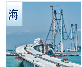
深中通道的非通航孔橋架設高度最高的箱樑架設。資料圖片