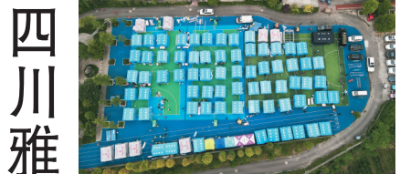
6月2日，航拍雅安市蘆山縣太平鎮太平中學安置點。