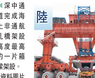
廣州鐵路樞紐新建廣州白雲站工程全線首樑架設完成。