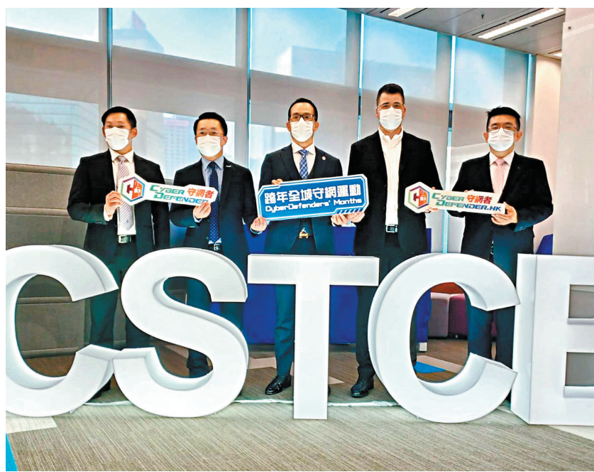
香港警方網絡安全及科技罪案調查科去年12月中展開「碩將行動」，移除數以千計殭屍電腦伺服器及釣魚網站，以淨化香港網絡。

民建聯選委會界別立法會議員葛珮帆接受香港文匯報訪問時表示，自己數年前已向特區政府提出網絡安全的重要性，如機場或集體運輸系統等基礎建