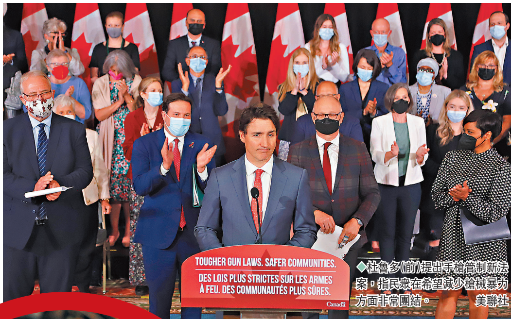
◆杜魯多(前)提出手槍管制新法案，指民眾在希望減少槍械暴力方面非常團結。