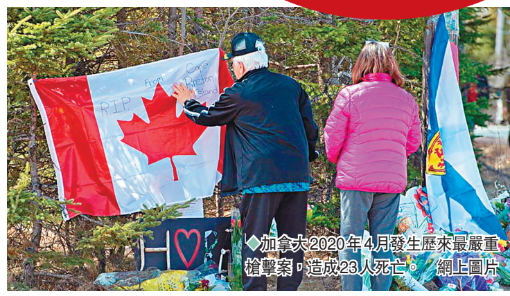
◆加拿大2020年4月發生歷來最嚴重槍擊案，造成23人死亡。網上圖片