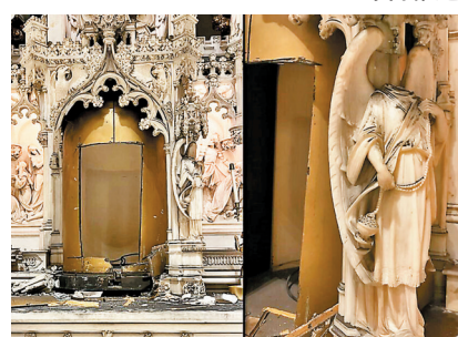
◆聖幕圍欄被鋸爛(左圖)，天使雕像頭部也被取走(右圖)。網上圖片