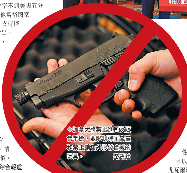
◆加拿大將禁止進口及販售手槍，並限制彈匣容量和禁止銷售外形像槍械的玩具。