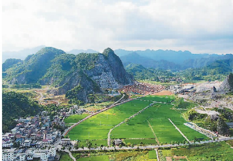
图为生态修复后的辉埠镇东坑村。

2018年10月，钱塘江源头区域成为国家第三批山水林田湖草生态保护修复工程试点。作为该试点的重要组成部分，常山县在辉埠镇开启了以产业整治、环境治理、提质升级为抓手的“蓝天三衢”生态治理工程，着力打造矿山公园，整个区域形成合理的生产、生态、生活空间划分。“蓝天三衢”生态治理工程共涉及6个村，总面积达5.3万亩，总投资8.98亿元。项目实施3年多来，新垦造水田735亩，“早改水”180亩，建设用地复垦总面积720亩。同时，整个片区关停165孔石灰立窑、201条石灰钙加工生产线、16家轻钙企业，实施矿山生态修复项目7个，修复面积达到2895亩。