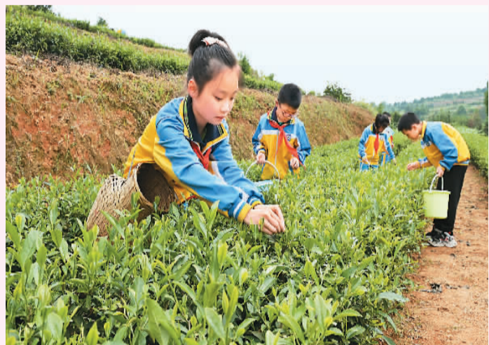
学生在湖南省邵阳市洞口县茶铺茶场茶园基地采摘茶叶。

5月28日，安徽一研学科普实践教育基地里，安徽师范大学附属肥西二中的学生正在学习包粽子。这节劳动课成为他们感受端午节传统文化魅力的独特方式。