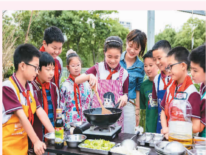
浙江省湖州市南太湖新区新风实验小学教育集团清河校区的学生在烹饪课老师的指导下练习制作西红柿炒蛋。