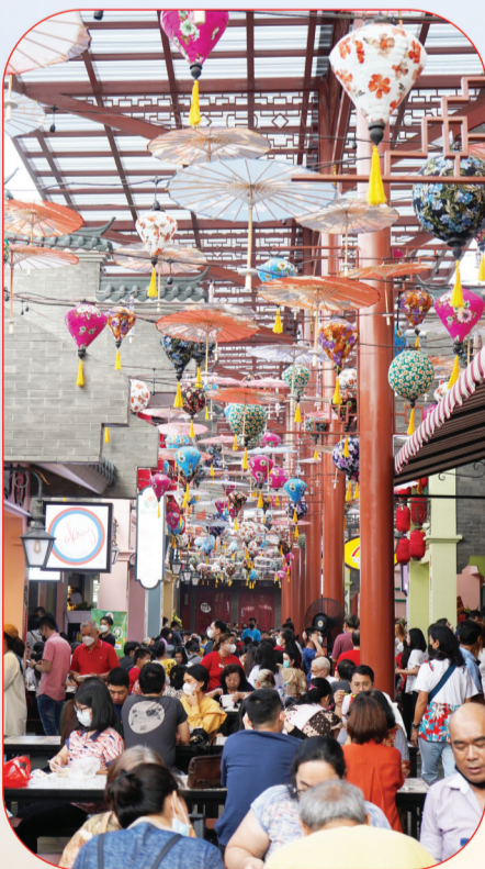
开业大吉, 人潮汹涌