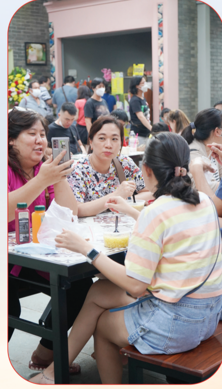
在老上海广场内相聚