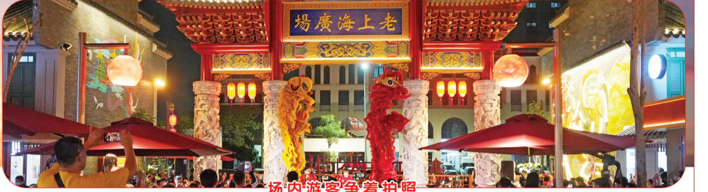
场内游客争着拍照