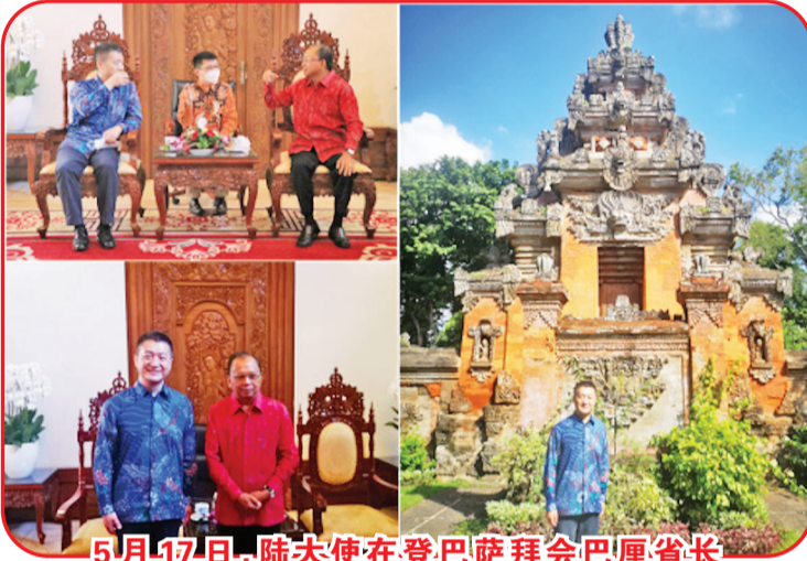
5月17日,陆大使在登巴萨拜会巴厘省长

【本报讯】据中国驻印尼使馆消息:2022年2月22日,陆慷大使偕夫人抵达“千岛之国”印度尼西亚,出任中国驻印尼大使。到任后,陆大使密集拜会印尼政要,走访各界,多次接受媒体采访,积极讲好中国和中印尼友好故事。让我们一同回顾下陆大使履新百日的精彩瞬间吧!