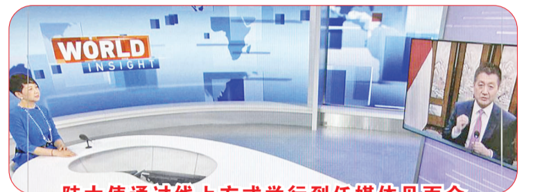
陆大使通过线上方式举行到任媒体见面会

主席叶赫亚和穆罕默迪领导层,感谢其为促进两国友好作出的积极贡献,表示中方愿同伊联和穆联加强交流合作,增进两国民众相互认知、理解和友谊,为中印尼关系发展夯实民意基础,促进中国与伊斯兰世界友谊,共同维护发展中国家利益。