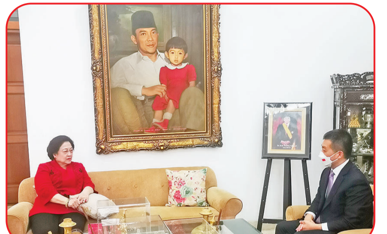
陆大使拜会印尼民主斗争党总主席、前总统梅加瓦蒂