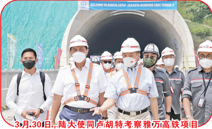
3月30日,陆大使同卢胡特考察雅万高铁项目