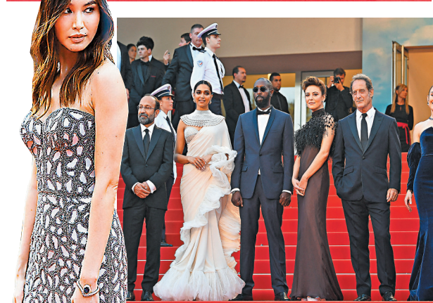
◆評審團主席 Vincent Lindon (中) 與評審團亮相閉幕禮。