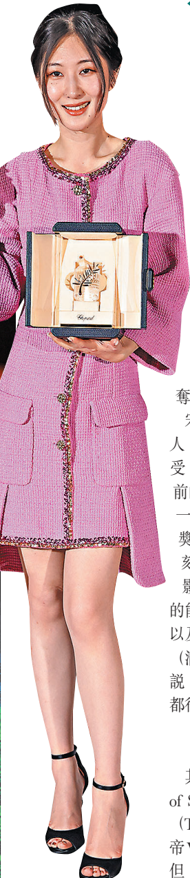
◆陳劍瑩為95後新生代導演。

今屆康城影展各獎項塵埃落定，首次獲得康城影帝的宋康昊，是史上首位韓國男演員獲此殊榮，同時是繼全度妍以《密陽》奪下康城影后後，第2位在康城影展獲獎的韓國演員；他主演的韓片《上流寄生族》2019年也在康城影展大放光芒。拿下最佳導演獎的朴贊郁，今次是繼《原罪犯》、《饑渴誘罪》、《下女誘罪》後第4度進軍康城主競賽單元，並第3度揚威康城影展，之前《原罪犯》奪得評審團大獎，《饑渴誘罪》則獲頒評審團獎。宋康昊領獎時難掩興奮之情，並表示多謝喜愛韓國電影的人。頒獎禮後，他與朴贊郁齊齊接受韓媒訪問，暢談得獎感受。宋康昊表示和朴贊郁導演合作電影《饑渴誘罪》已是13年前的事了，對此，朴贊郁打趣笑說：「希望他（宋康昊）不要一直拒絕我了，時間到了會再合作。」宋康昊表示當宣布他得獎時，朴贊郁特意跑過去跟他擁抱，令他十分感動，直言那一刻很難忘。他又謙稱：「這次只是被邀請到世界上最好的電影節，體驗拿獎的一個過程。」對於近年韓國電影在國際間的能见度火速提升，宋康昊認為是韓國電影長期不斷的挑戰，以及努力不懈的變化。至於《分手的決心》拿下康城場刊3.2分（滿分4），是今年主競賽中唯一超過3分評價的電影，朴贊郁說：「評分和獲獎結果不完全相關，過去看過很多例子，這點都很清楚。」