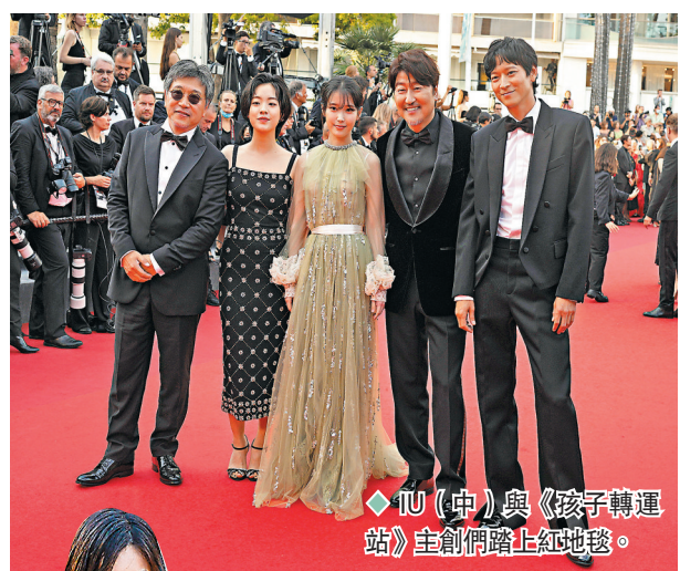
◆IU(中)與《孩子轉運站》主創們踏上紅地毯。