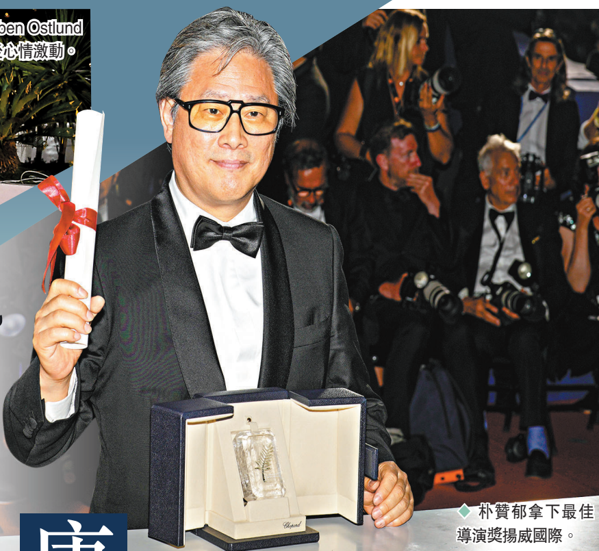
◆朴贊郁拿下最佳導演獎揚威國際。

香港文匯報訊 第75屆康城電影節頒獎禮於香港時間前日凌晨舉行，韓國電影再獲肯定，55歲有韓國「國民影帝」之稱的宋康昊憑日本導演是枝裕和執導的首部韓片《孩子轉運站》成為今屆康城影帝；朴贊郁執導的《分手的決心》則拿下最佳導演獎，而影片女主角湯唯爭影后就大熱倒灶。中國女導演陳劍瑩憑《海邊升起一座懸崖》斬獲短片金棕櫚獎，她上台領獎時，還特意用華語向團隊、出品方、父母以及祖國的土地表達了誠摯的謝意。