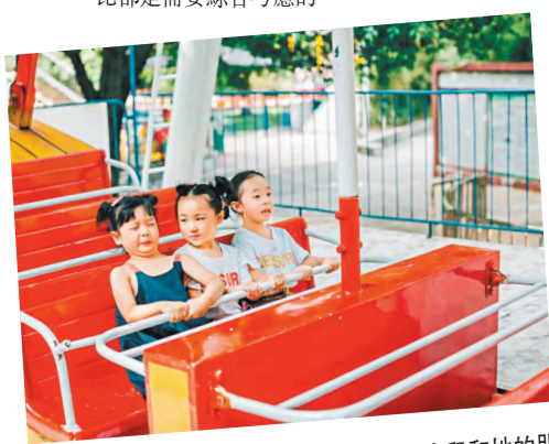
◆侯女士去年「六一」節請攝影團隊為女兒和她的朋友們在公園拍攝。