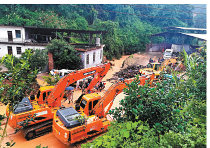
◆5月27日，福建森林消防員在龍岩市武平縣山體滑坡區域進行救援。 中新社

同時，自然資源部66名專家分赴各地，一線駐守加強基層地質災害防禦技術支持，聯合各