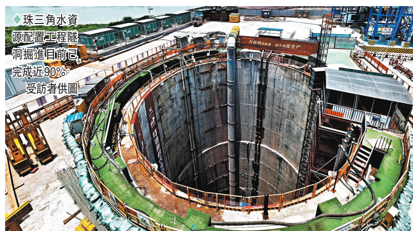
◆珠三角水資源配置工程隧洞掘進目前已完成近90%。

施工方表示，珠三角水資源配置工程的建設，將重塑廣東水資源配置格局，將實現從西江水系向珠三角東部地區供水，有效改變以往東江單一供水格局，解決深圳、東莞、廣州南沙等地發展缺水問題，緩解粵港澳大灣區水資源供需矛盾，提高包括香港在內的灣區城市供水安全性和應急保障能力。