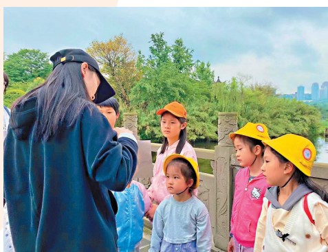
◆美術老師達達說，今年「六一」兒童節，戶外寫生小分隊已經提前報滿。