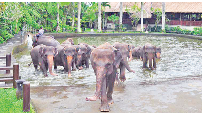
大象们准备快乐地游泳