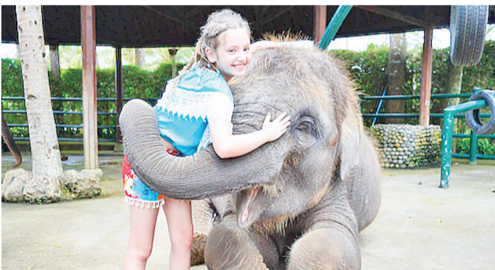
小游客们和大象亲密玩耍

的尼格先生谈到,虽然我们的遭遇有时候令人沮丧,但是回想起大象们曾经带给我们的快乐和利润,我们也不能忘却。这次疫情袭击是全球性的,我们必须要有积极的态度来面对未来。困难总会暂时的,此次的付出已耗尽了我们的过去七年努力工作所赚取的利润,但是我们坚信这些可爱的大象会再次给我们带来好运和幸福。对一个人许下诺言不可轻易更改,对动物也是一样。 如果您有机会来到巴厘岛,不妨去大象公园和这些可爱的大象来一次亲密接触,观看它们懒懒地在公园行走或在泳池里肆无忌惮地游泳,相信您肯定会有一趟愉快的参观,同时无形中也给予了一些捐赠。 本报记者叶露