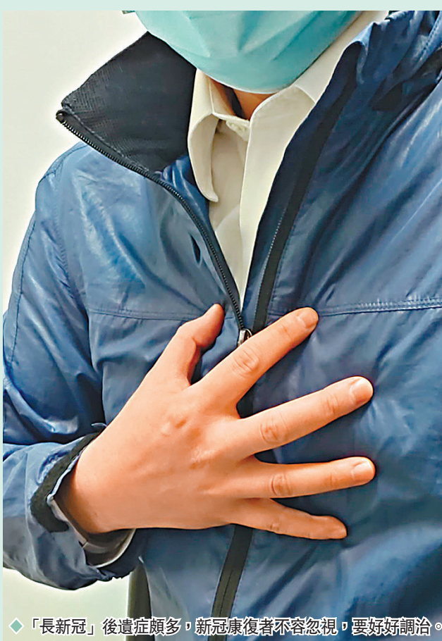
「長新冠」後遺症頗多，新冠康復者不容忽視，要好好調治。