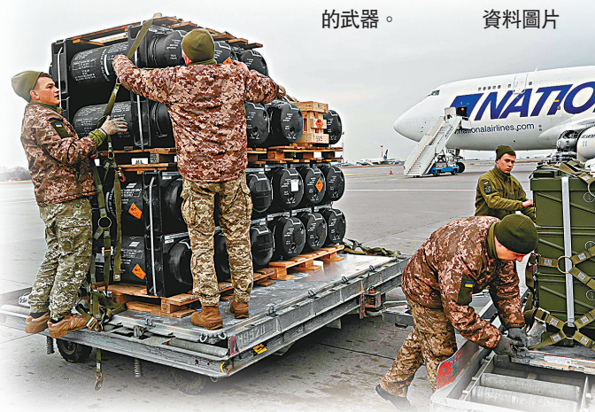
◆烏克蘭士兵卸載美國提供的武器。