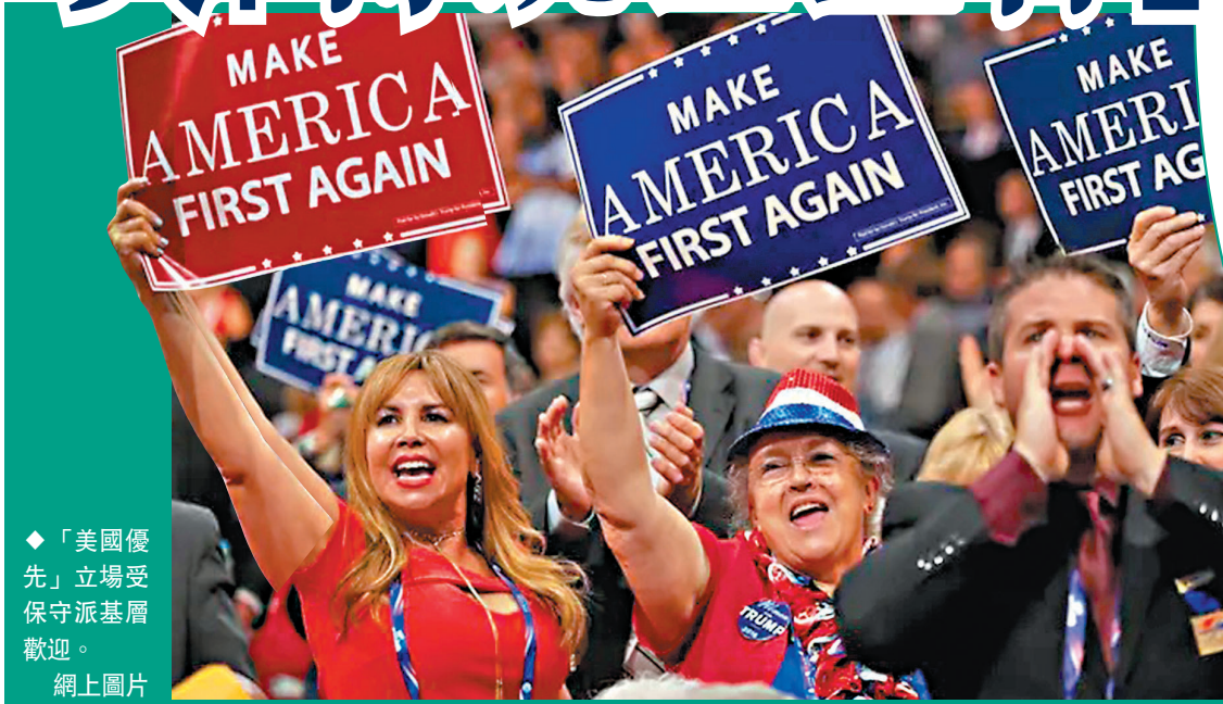
◆「美國優先」立場受保守派基層歡迎。網上圖片