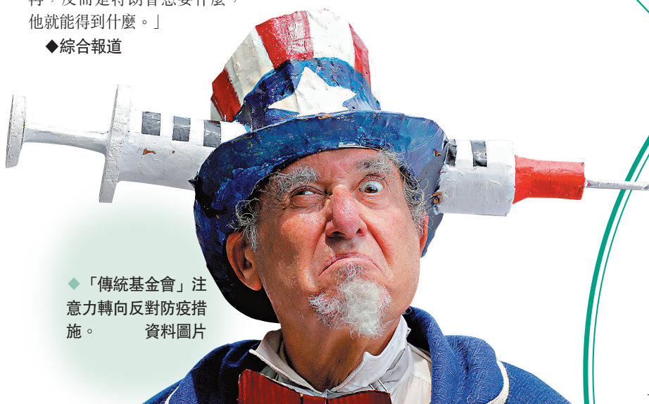
◆「傳統基金會」注意力轉向反對防疫措施。資料圖片