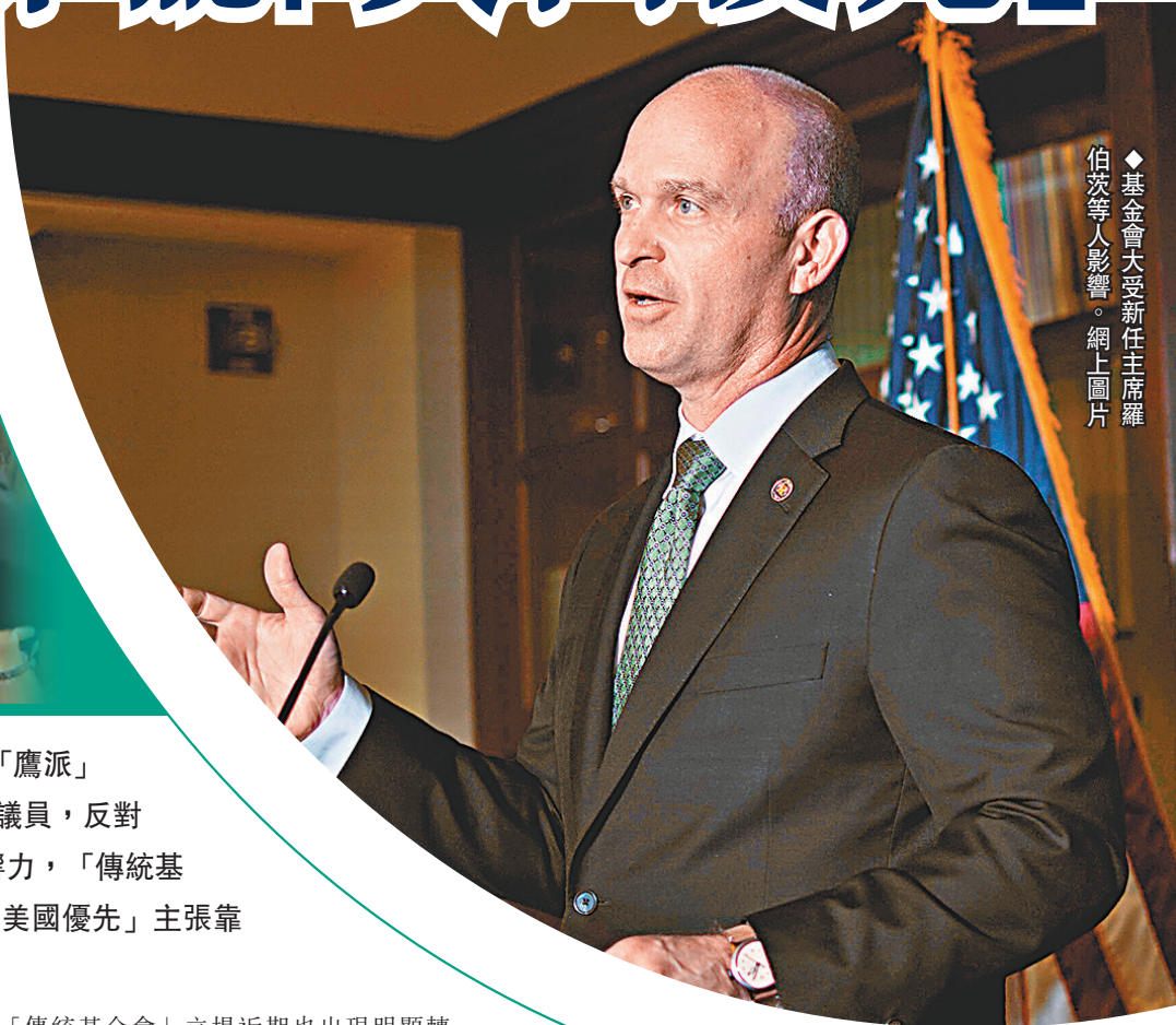
◆基金會大受新任主席羅伯茨等人影響。

美國智庫「傳統基金會」多年來被視為保守派領導的智庫之一，但這個長期持「鷹派」外交主張的智庫，近日卻罕有以「維護美國利益」為由，施壓數十名共和黨國會議員，反對美國對烏克蘭的總值400億美元援助法案。《紐約時報》指出，為維持在共和黨內的影响力，「傳統基金會」在經濟外交等領域的態度，已開始受到極右思潮滲透，向前總統特朗普時期的「美國優先」主張靠攏，但該組織仍聲稱專注與中國抗衡，反映其繼續外交干預的本質並沒有改變。