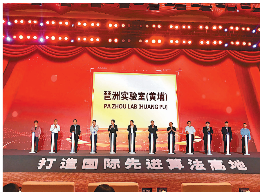
◆琶洲實驗室（黃埔）28日正式揭牌。