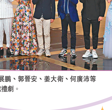
詩詠、山聰、展鵬、郭晉安、姜大衛、何廣沛等均有參與慶回歸獻禮劇。