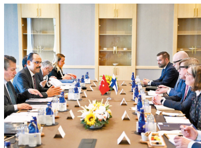
◆土耳其官員與芬蘭官員展開首輪磋商。 美聯社

圍繞瑞典和芬蘭申請加入北約的爭議，土耳其與瑞芬兩國官員25日在土耳其首都安卡拉舉行首輪磋商，會後土耳其表示，土方已向芬蘭、瑞典代表團重申，除非兩國滿足土方的安全關切，否則兩國加入北約的申請將不會獲進展。