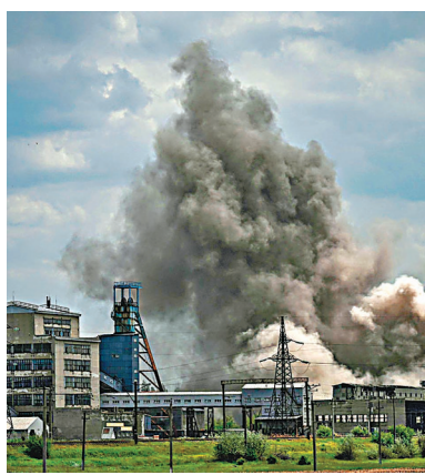
◆烏方指俄軍炮擊了頓巴斯地區的40多個城鎮。