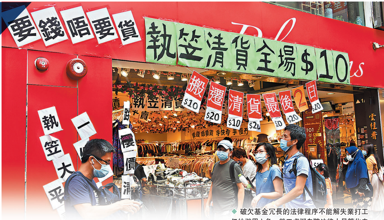
◆破欠基金冗長的法律程序不能解決失業打工仔的燃眉之急，勞工處擬自聘法律人員簡化申請程序。