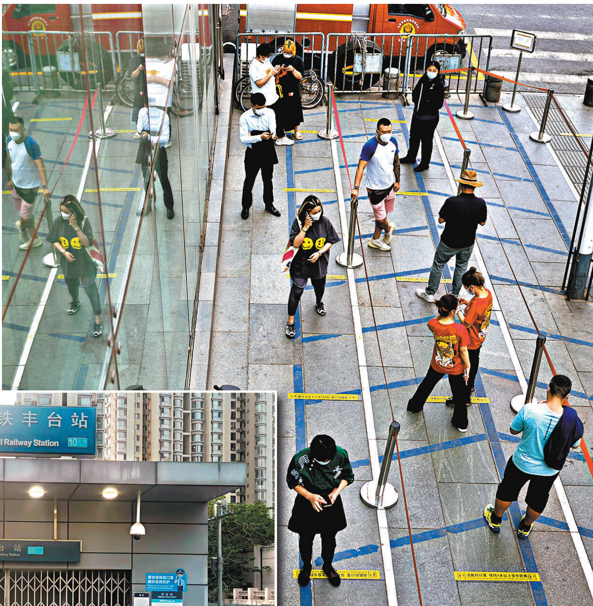
▲多區篩查發現社會面零星散發病例。圖為人們在北京一間商場外排隊等待核檢。

此外，北京還向主要農產品批發市場和大型連鎖超市派出了駐場人員，對企業經營運營情況、存貨和斷貨以及每日車輛通行及進場車輛情況進行監測，特別是重點加強對封管控小區周邊網點監測，加之500餘輛蔬菜直通車統籌調動，可隨時根據需要保障疫情小區供應。