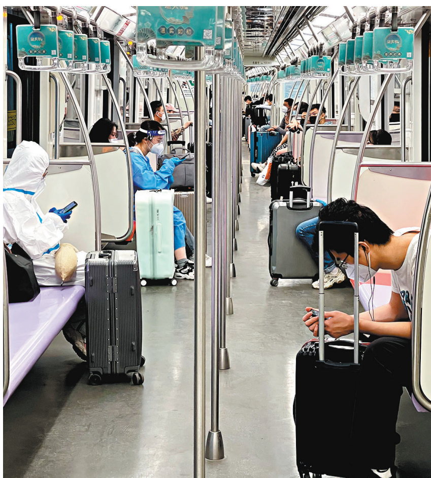
◆地鐵開通，儘管需要輾轉換乘，仍然給不少乘客帶來方便。

經過一天的運營，考慮到客流量密度不小，地鐵運營方立即調配了備車增加運能，並將原本20分鐘一班的間隔縮短到了10分鐘。另外為了方便離滬旅客，23日起，10號線在首班車前還將增開三列開往虹橋火車站的加班車。其中，前兩班的起點設置在浦西的江灣體育場站。