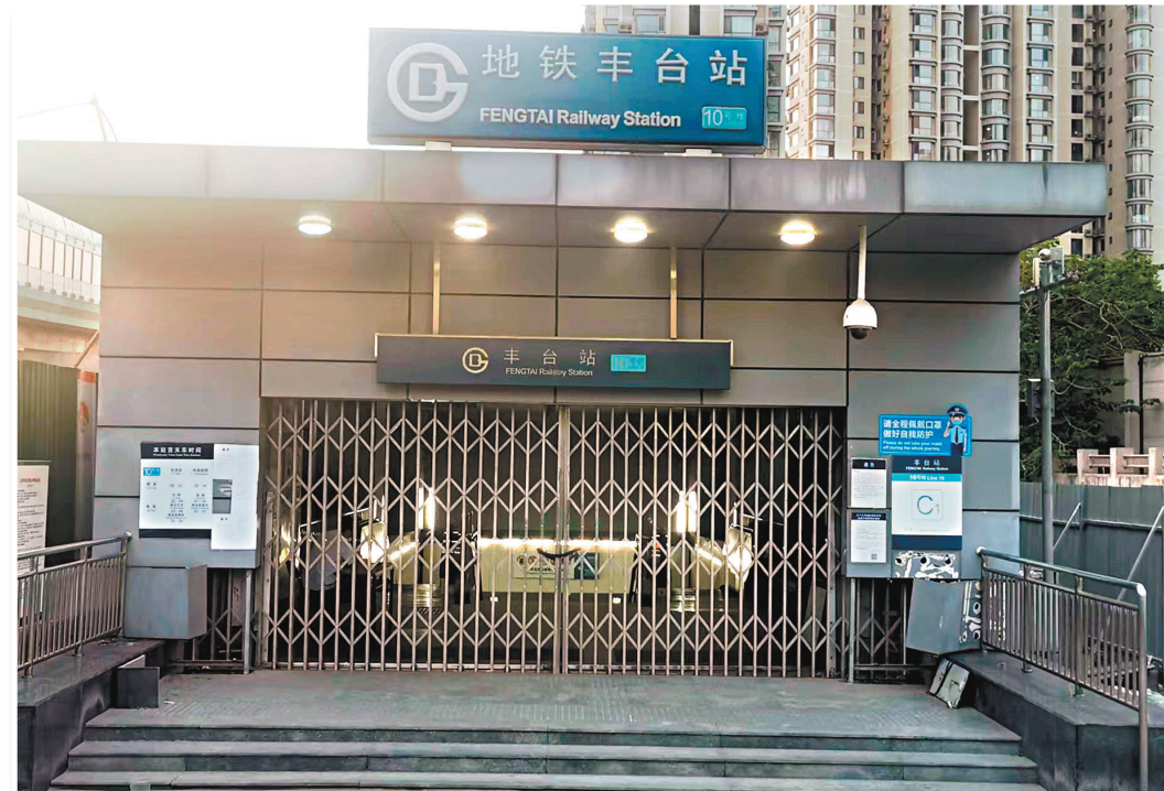
◀目前，在北京豐台區，除了北京南站、北京西站外，其它地鐵站點全部封站。