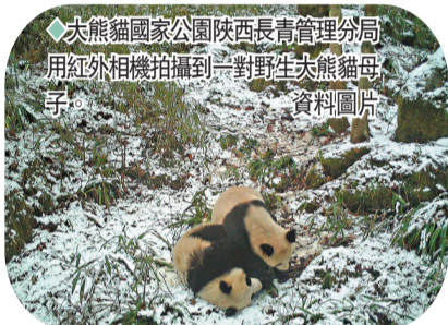
◆大熊貓國家公園陝西長青管理分局用紅外相機拍攝到一對野生大熊貓母子。 資料圖片