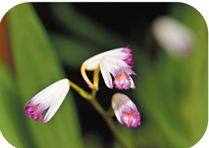
◆時隔120多年，雲南再度發現野生瀕危植物華白及。

瀕危物種穩中有升 ◆十八大以來，國家重點野生動物物種保護率提高到74%。 ◆近年來，中國系統實施瀕危物種拯救工程，300多種珍稀瀕危野生動物野外種群數量穩中有升，有效保護了90%的典型陸地生態系統類型。 ◆目前，中國建有各級各類植物園近200個，收集保存了2萬多個物種，佔中國植物區系的2/3，野外回歸珍稀瀕危植物達206種，其中112種為中國特有。 資料來源：人民日報