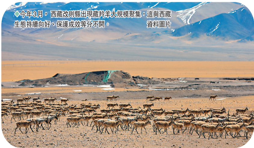
◆今年3月，西藏改則縣出現藏羚羊大規模聚集，這與西藏生態持續向好、保護成效等分不開。

《中國生物物種名錄》不斷更新的數據，也是近年來中國學者在生物多樣性保護研究中不斷取得新進展、新突破的一個縮影。值得一提的是，2021年度中國學者在菌物分類學研究中取得了令人矚目的成果，380位中國學者參與發表了1,124個菌物新名稱，佔全球新名稱總數的近1/3。