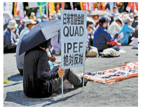
昨日，一名日本抗議者舉着標語牌，抵制日美首腦會晤和美日印澳「四邊機制」峰會。

【香港商報訊】綜合消息，當地時間22日下午，美國總統拜登乘坐專機抵達日本東京的美軍橫田基地，開始了為期3天的對日本訪問。這是拜登任後第一次訪問日本。