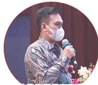
苏北宗教部佛教局局长献词

【本报圣城讯】21日上午9时，大丛山住持率领僧伽、佛弟子赞扬佛陀舍利并在大殿坛城内绕佛至前往庆典大礼堂。大丛山住持率僧伽、佛弟子赞扬佛陀舍利并在大殿坛城内绕佛至前往庆典大礼堂。大丛山住持率僧伽、佛弟子赞扬佛陀舍利并在大殿坛城内绕佛至前往庆典大礼堂。