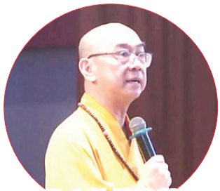
大丛山住持致谢词