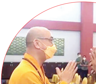
欢迎苏北副省长莅临大丛山礼堂