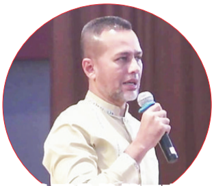
苏北副省长献卫塞词