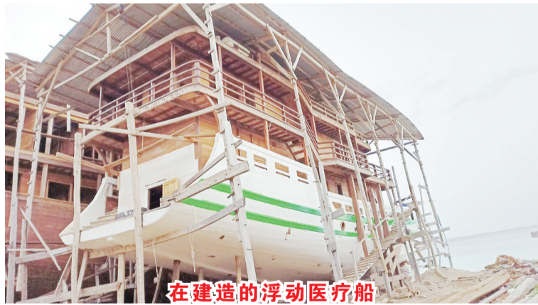
在建造的浮动医疗船