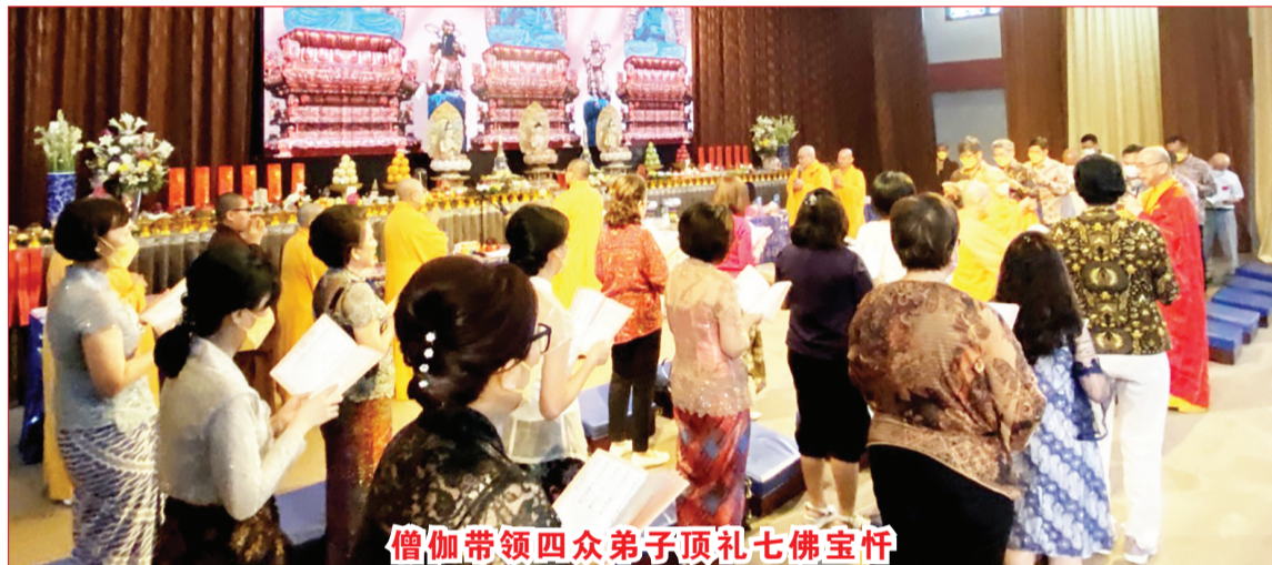
僧伽带领四众弟子顶礼七佛宝忏

当天上午除了赞扬佛陀舍利，本寺青年舞蹈团呈献佛教舞蹈，最后大丛山住持迎请政府长官、各界嘉宾共同燃灯，卫塞祈福。大会主宾离开现场后，大丛山住持及所有的法师带领四众卫塞顶礼慈悲七佛宝忏。