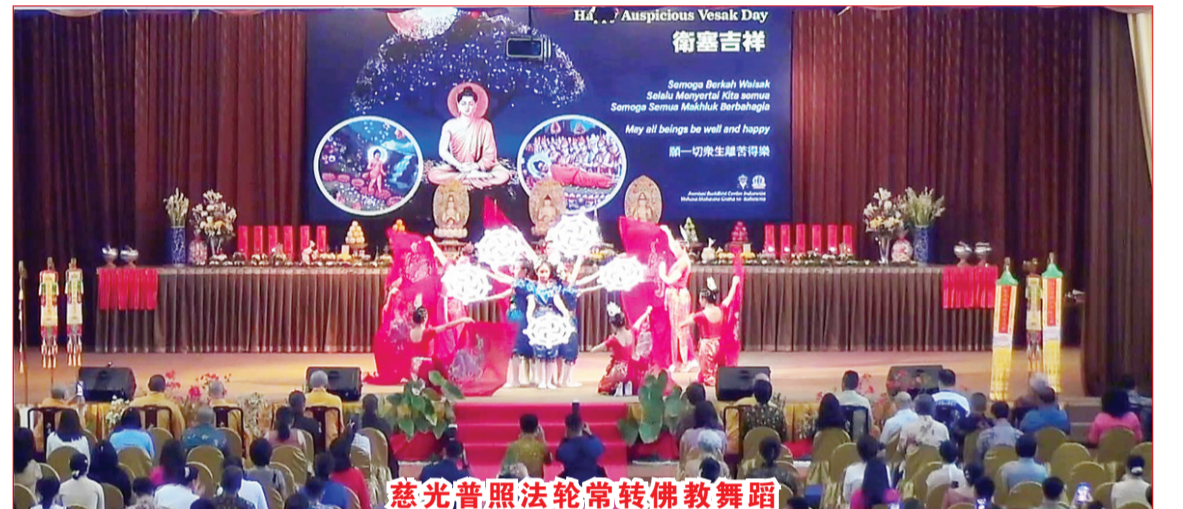
慈光普照法轮常转佛教舞蹈