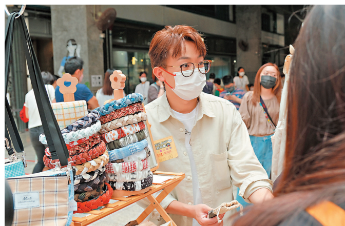
◆ 岑珈其出席香港家福會活動，客串擔任市集店主。

香港文匯報訊 (記者 阿祖) 人氣暖男爸爸岑珈其 21日為香港家庭福利會「Home-land」家庭市集開幕嘉賓，分享其家庭生活日常及大談與兒子瑣瑣相處趣事：「初為人父少不免有好多嘅事情，但係我覺得呢啲真正就係屬於我嘅家庭幸福同溫暖，亦都覺得呢種正面氛圍係可以感染到身邊人，所以好開心今次家福會邀請我。」他更謂自己非常認同家福會舉辦「家福月」的「最緊要一家人」理念，直言家人支持是他工作的最大動力。