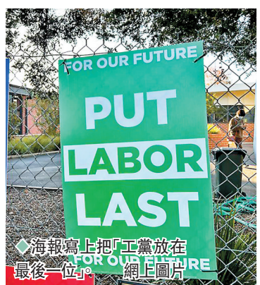
◆海報寫上把「工黨放在最後一位」。網圖

澳洲維多利亞州3個選區早前出現多張針對工黨的宣傳海報，寫上「為了我們的未來，把工黨放在最後一位」字句，海報為綠白兩色，令人容易聯想到是由綠黨製作，綠黨否認此事，並表示已建議選民進行策略性投票時，票投工黨而非自由黨。工黨則指控自由黨暗中張貼具誤導性的海報，並成功取得法院禁制令，可移除3個選區內的虛假海報。