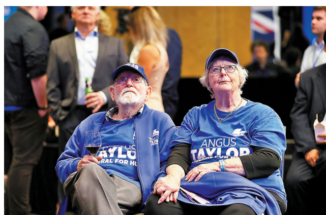
◆自由黨支持者大感失望。

洪災，令氣候暖化成為今次大選重要議題，但莫里森政府的氣候政策明顯令選民不滿，成為執政聯盟的致命傷之一。擊敗弗萊登伯格的瑞安亦是因不滿政府應對氣候問題不力而決定參選，並主打「環保牌」，結果成功當選。 ◆綜合報道