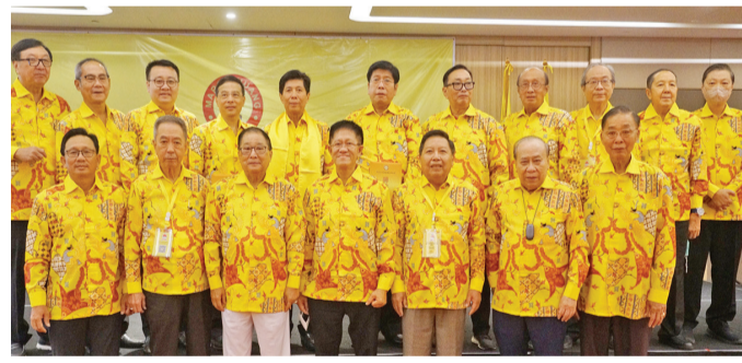
全體理事與永久榮譽主席團教育